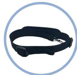
Inogen One ® G4 Tragegurt tragen* Artikel # CA-401

Ungefähr halb so groß wie der Inogen One G3!