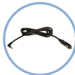
Inogen One ® G4 DC-Stromkabel* Artikel # BA-306