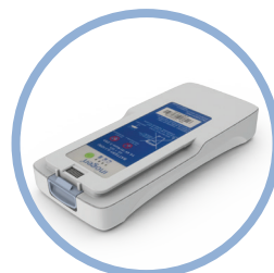
Inogen One ® G4 Lithium-Ionen-Batterien* Bis zu 2.7 Stunden Laufzeit Artikel #BA-400

Ungefähr halb so groß wie der Inogen One G3!