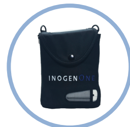
Inogen One ® G4 Tragetasche* Artikel # CA-400