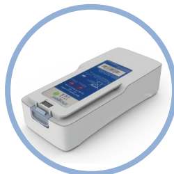
Inogen One ® G4 Erweiterter Lebensdauer Lithium-Ionen-Batterie** Bis zu 5 Stunden Laufzeit Artikel #BA-408