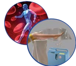
Wundheilung mit Sauerstoff O 2 -TopiCare Wundsystem