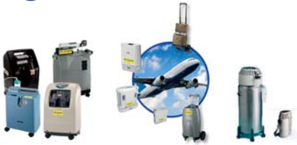
Konzentratoren, stationär + mobil Füllstationen, FlüssigO 2