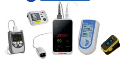
Pulsoxymetrie, Kapnographie, SISS Babycontrol Blutdruckmessung