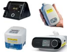
CPAP/autoCPAP/ BiLevel/BiLevel ST/Cheyne Stokes