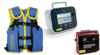
VibraVest Die hochfrequente Vibrations-Weste Pulsar Cough/Cough Assist E70 Hustenassistent mit Vibrationsmodus.