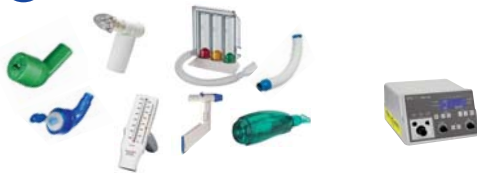
GeloMuc / Flutter / Quake / Cornet / Cornet Plus / Acapella / IPPB Atemtherapie RespiPro / PowerBreathe medic Alpha 300 mit Inhalation