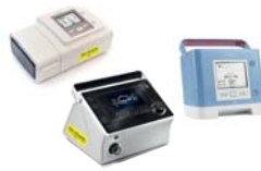
BiPAP A40 Silver Series, Trilogy von Philips Respironics prisma VENT30/40/50-C von LöwensteinMedical