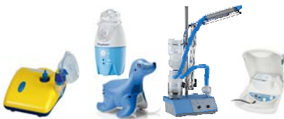
Membran-Vernebler, Ultraschallvernebler, Vernebler mit Schall-Vibration insbesondere für Nasennebenhöhlenentzündung