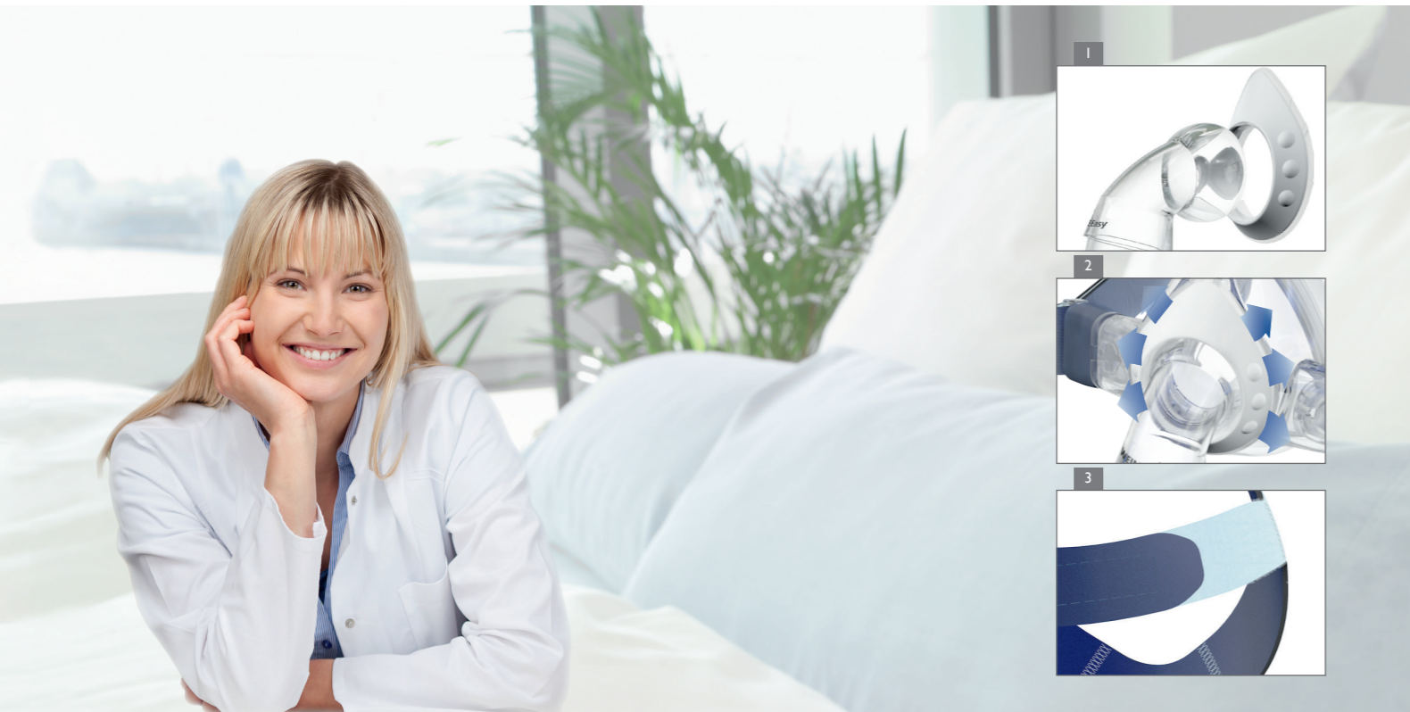
JOYCEeasy next FF