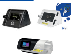
CPAP/autoCPAP/ BiLevel/BiLevel ST/Cheyne Stokes