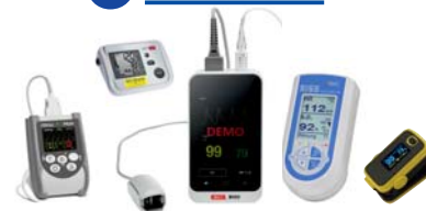
Pulsoxymetrie, Kapnographie, SISS Babycontrol Blutdruckmessung