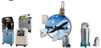
Konzentratoren, stationär + mobil Füllstationen, FlüssigO2