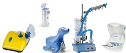
Membran-Vernebler, Ultraschallvernebler, Vernebler mit Schall-Vibration insbesondere für Nasennebenhöhlenentzündung