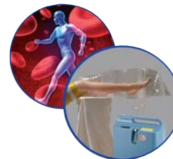
Wundheilung mit Sauerstoff O2-TopiCare Wundsystem