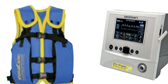
VibraVest Die hochfrequente Vibrations-Weste, Comfort Cough II Hustenassistent optional mit HFCWO