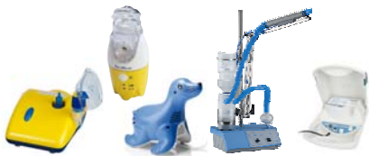
Membran-Vernebler, Ultraschallvernebler, Vernebler mit Schall-Vibration insbesondere für Nasennebenhöhlenentzündung