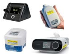
CPAP/autoCPAP/ BiLevel/BiLevel ST/Cheyne Stokes