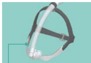
Konturierter Maskenrahmen Maskenstabilität

Die anatomisch geformten Kissen sorgen für guten Sitz und ausgezeichnete Abdichtung. Die Konturen der Nasalkissen bieten mehr Tragekomfort. Die mitgelieferten Größen (S, M, L) sorgen dafür, dass Komfort und Abdichtung nicht beeinträchtigt werden.