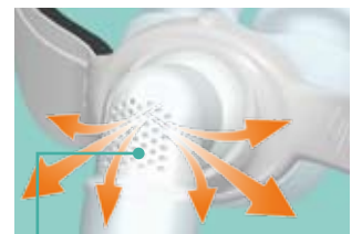
Leistungsstarke Ausatemöffnung Geräuscharmer Betrieb

Das innovative Gelenk erlaubt es, den Schlauch oben oder an der Seite zu fixieren, oder aber ihn frei beweglich zu lassen. Elegantes, einfaches Design sichert den Schlauch in der gewünschten Position. Er kann jedoch auch unverankert bleiben, so dass das Kugelgelenk sein Spiel voll entfalten kann, was volle 360° Bewegungsfreiheit schafft.