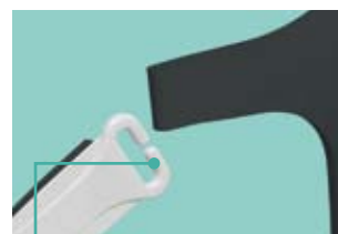
Versteckte Kopfbandöffnung One-Step Öffnung

Diese Abdichtungstechnologie bietet eine weiche, glatte Fläche, die leicht an die richtige Stelle gleitet, und die matte Oberfläche sorgt für optimale Maskenabdichtung. Das fortschrittliche Luftverteilersystem ist leise und sorgt für minimale Geräusch- und Zugentwicklung der Abluft, so dass Patient und Partner ungestört schlafen können.