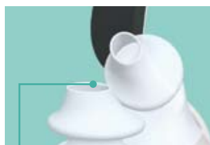
Premium mattierte Silikon Abdichtung Technologie für optimale Abdichtung

Die Silikonabdichtung liegt weich an der Nase und biegsam auf der Oberlippe mit einem eingebauten Soft-Lip™-Kissen, welches sich an die natürliche Form der Oberlippe anschmiegt und höchsten Tragekomfort gewährleistet.