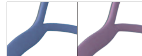
AirFit P10 Flexibles Doppelkopfband 62935 Standard