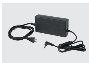
WECHSELSTROM- NETZTEIL (SÄMTLICHE KABEL ENTHALTEN)