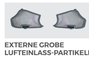
EXTERNE GROBE LUFTEINLASS-PARTIKELFILTER