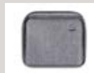
Premium-Reisetasche für AirMini