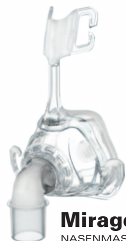
Mirage™ FX NASENMASKE