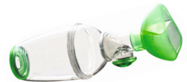
Abb.2: Tipshaler® mit OrHal® Maske

Der Tipshaler® Medikamentenspacer kombiniert mit der OrHal® Inhalationsmaske ist eine ideale Ergänzung zur Inhalationstherapie mit pMDI's. Die OrHal® Inhalationsmaske und das patentierte, innenliegende Isobreath® Inspirationsventil des Tipshaler's® sorgen für eine tiefe Deposition des Aerosols in der Lunge und bieten Ihrem Kind mehr Zeit für die Inhalation. Das Isobreath® Inspirationsventil erzeugt einen niedrigen Inspirationswiderstand, welcher sich an jeden inspiratorischen Fluss des Kindes anpasst. Dem Kind wird somit eine leichtere Inhalation ermöglicht. Ein am Tipshaler® zusätzlich integriertes Expirationsventil ermöglicht die Ausatmung direkt aus dem Spacer, ohne diesen absetzen zu müssen.